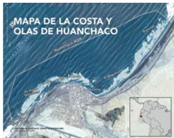
Figura 1. Mapa de Reserva Mundial de Surf, Save the Waves Coalition

Huanchaco es un lugar que alberga una cultura de surf y una historia marítima robusta. Antes del Imperio de los Inca, los pescadores de la costa de Perú ya eran expertos en cosechar sus alimentos del mar. Para poder atravesar la zona de impacto y las olas, los antiguos peruanos crearon un artefacto que pudiera resistir el oleaje y también les permitiera pescar a lo largo de la orilla (Cueva, 2013). Estos artefactos que ahora son conocidos como “caballitos de totora,” eran balsas tejidas a mano que fueron utilizadas por todos los pescadores que fueran capaces, y se ha sugerido que eran utilizadas para deslizarse sobre las olas para que los llevaran a la orilla haciéndolos uno de los primeros artefactos de surf en el mundo. Hoy en día todavía se siguen utilizando en Huanchaco y representan la fuerte cultura marítima que persiste en esta costa.