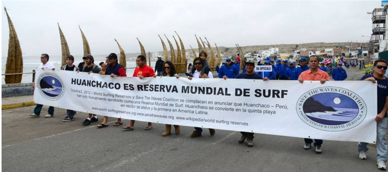
Figura 2. Apoyo de la comunidad para la Reserva Mundial de Surf en Huanchaco, Save the Waves Coalition

Huanchaco está ubicado 12 kilómetros al oeste de la ciudad de Trujillo en el norte del Perú. La atracción principal de surf es el rompiente de izquierda conocido como Huankarute. La punta al sur del muelle se considera como una ola para principiante y es utilizada por las escuelas de surf de Huanchaco.